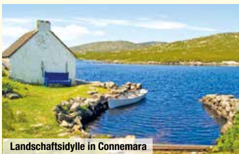
Landschaftsidylle in Connemara