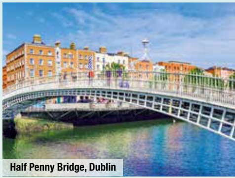
Half Penny Bridge, Dublin

Malerische Landschaften, verwunschene Städtchen und reiche 7-tägigen Rundreise mit Flug und Bus die