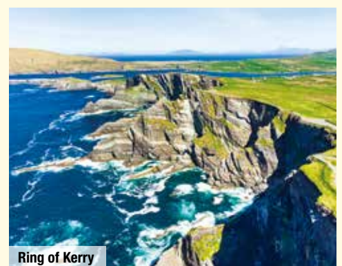
Ring of Kerry