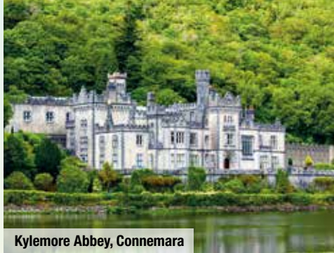
Kylemore Abbey, Connemara