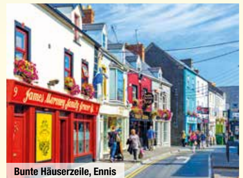
Bunte Häuserzeile, Ennis