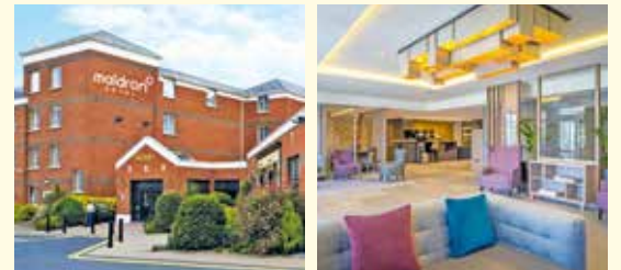
Maldron Hotel Newlands Cross, Dublin