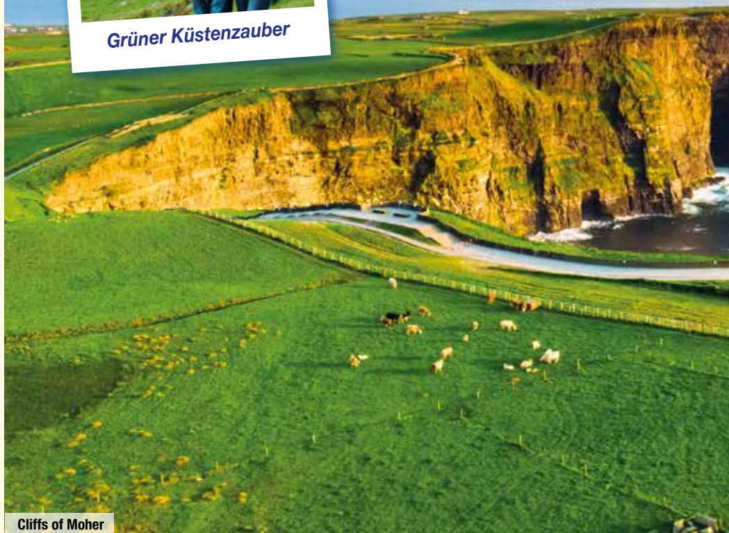
Cliffs of Moher