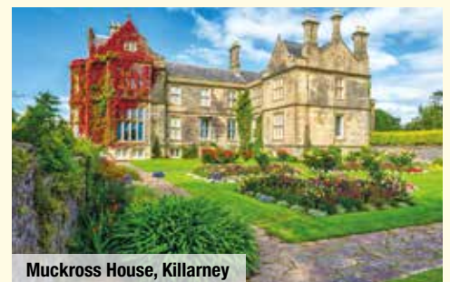
Muckross House, Killarney