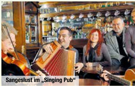
Sangeslust im „Singing Pub“